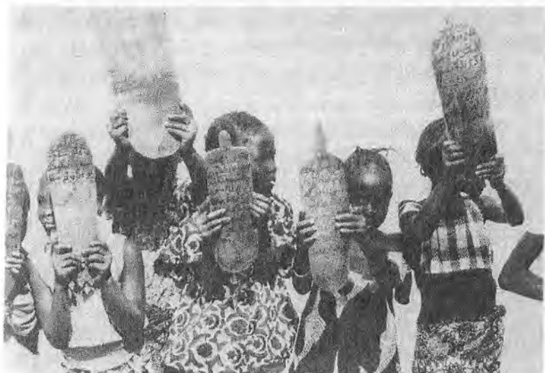
Système d'enseignement " traditionnel " et contemporain dans le Nord-Sahélien : école coranique et médersa.

D'ailleurs, la scolarisation africaine précoloniale s'est développée parallèlement à l'éducation originelle. Cette scolarisation se faisait souvent à travers la langue arabe et parfois à travers les caractères arabes dans les langues autochtones (ajami).