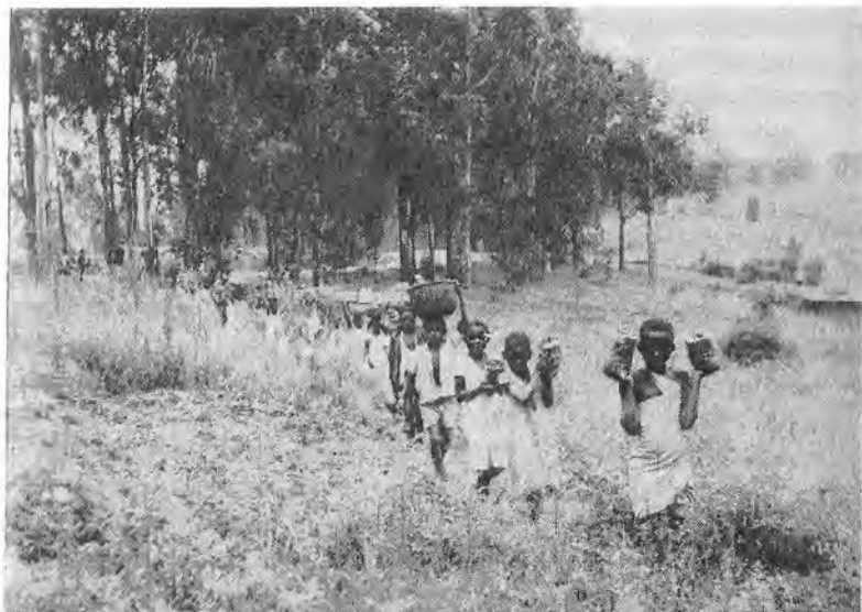
La participation des enfants à la construction de leur école au Rwanda.

Enfin, l'école n'apprend pas à produire parce que ses produits sont comme des extra-terrestres débarquant sur le marché. Mais sur ce point précis, le secteur industriel est aussi peu adapté que l'école. En somme, l'école participe à un non-ajustement structurel généralisé, dans le cadre d'un ajustement par rapport au statu quo interne et international.