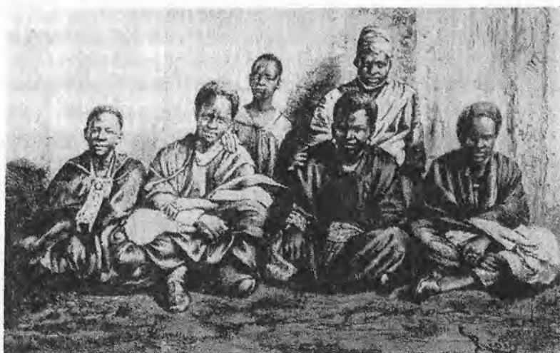
École des otages (1870). Sur la photo : 2 ème à partir de la droite, le fils du roi de Médine (province de l'ancien Soudan français devenu Mali) en compagnie de son gardien et d'autres enfants de chefs africains.

un sous-système du système global de domestication de l'Afrique. Le ministre français des colonies, Albert Sarraut, l'énonce clairement : " Instruire les indigènes est assurément notre devoir. Mais ce devoir s'accorde de surcroît avec nos intérêts économiques, administratifs, militaires et politiques les plus évidents." 1