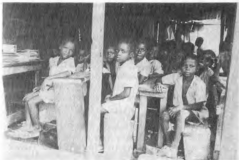
École dans l’informel : enfants du quartier spontané “de Zoé Bruno” (Abidjan) (Unicef/Murray Lee).

extrêmement lourd. La nouvelle initiation à la vie “moderne” à travers la pseudo-ville africaine coûte beaucoup plus cher en vies humaines que l’initiation des forêts sacrées. Les villes font victorieusement concurrence à l’école et, par leurs messages immédiats et pratiques, elles arrivent à effacer les leçons du tableau noir. C’est ce qu’exprime la réponse suivante d’un adolescent lors d’une enquête sur les enfants de la rue : “Je fais ce travail (lavage de voiture) parce que ne je peux retourner vers mes parents sans leur apporter quelque chose. Aujourd’hui, quand on n’a rien, on n’a pas de parents.” Remarquons l’accent mis sur le mot avoir qui nous renvoie à la définition de l’argent comme “équivalent général”, ici, entre le gain monétaire et le rapport existentiel de la parenté. Dure leçon de la vie qui englobe le système éducatif lui-même ; car, celui qui, après quinze ans dans ce système, en sort sans avoir de diplôme, sans avoir un job et donc, sans avoir d’argent, n’est rien non plus. Dans le système originel, on aurait plutôt dit : “Quand on n’a pas de parents, on n’est rien...” Or, l’enfant ne pouvait pas en principe manquer de parents. Et même aujourd’hui, ce sont les puissantes survivances du système lignager africain qui assument les responsabilités premières en faveur des enfants malades, sans ressources pour leurs études, sans nourriture, etc... Cela démontre la complexité des mutations socio-culturelles et économiques en cours.