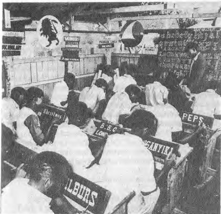
Kenya/Nairobi : Centres de jeunesse : classe de dessinateurs lettristes..

système sous le couvert de la professionnalisation, de la ruralisation, etc. De même que l'alphabétisation serait développée pour ceux qui n'ont pas eu accès au temple de l'école, de même l'éducation liée à la production serait réservée à ceux qui, refoulés de l'usine scolaire, seraient des produits à peine dégrossis, récupérés pour être recyclés dans la périphérie du système. Ce dernier sera donc jugé à la solution concrète de ce problème fondamental qui pose la question du mode de production démocratique ou aristocratique, auto-centré ou néo-colonisé. En effet, une éducation africaine qui produirait des consommateurs uniquement pour la production étrangère serait une éducation pour la dépendance. Dans une Afrique qui opte pour la sécurité alimentaire et où la formation des cadres de l'économie informelle constituera une demande de plus en plus grande, la combinaison de l'éducation avec la production sera un défi majeur pour l'éducation africaine.