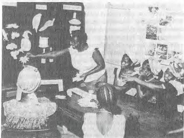
L'enseignement de la nutrition en Sierra Leone (Unicef/photo Larsen).