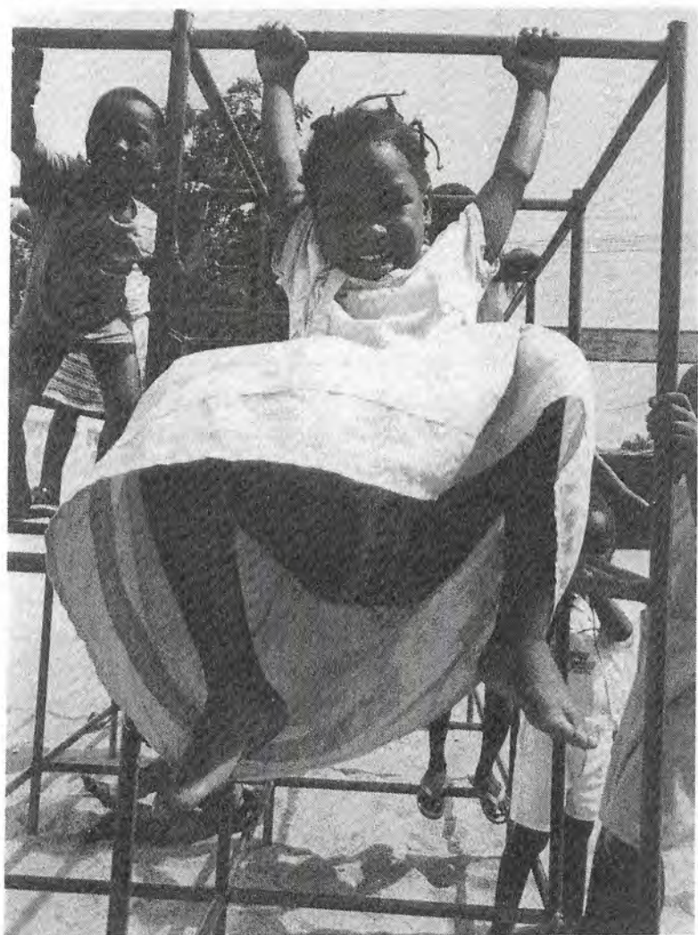
Éducation pour l'avenir dès la prime enfance : centre d'éveil et de stimulation de l'enfant au Bénin. (Unicef, Murray/ Lee).

Ainsi il n'y a pas de vraie éducation pour tous si elle n'est pas permanente. L'éducation pour tous, en Afrique et ailleurs, doit être immanente.