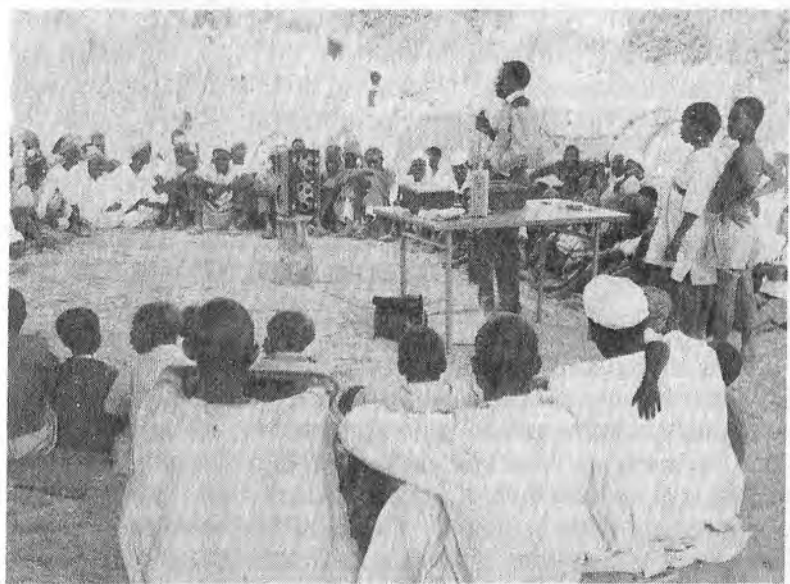
Une forme d'éducation à la base efficace : les radio-clubs au Niger. (Coopération : Almasy).