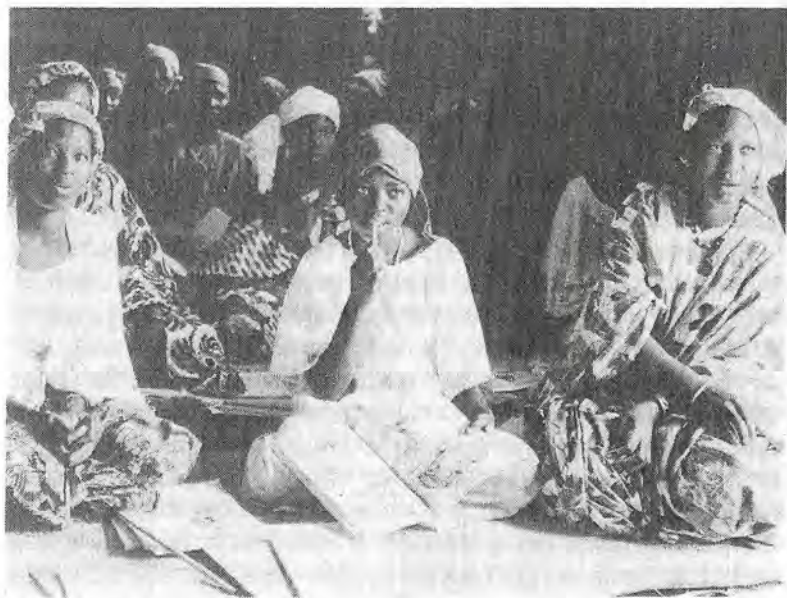
Femmes en formation : Cours d'alphabétisation s'inscrivant dans un programme de Sécurité alimentaire. Diré (Mali).

Ainsi donc, assurer l'Éducation pour tous, c'est rendre à des pans entiers de l'Humanité, la visibilité , non pas en les traînant comme des boulets ou en les extrayant du trou de l'ignorance, mais simplement en leur permettant de se tenir debout.